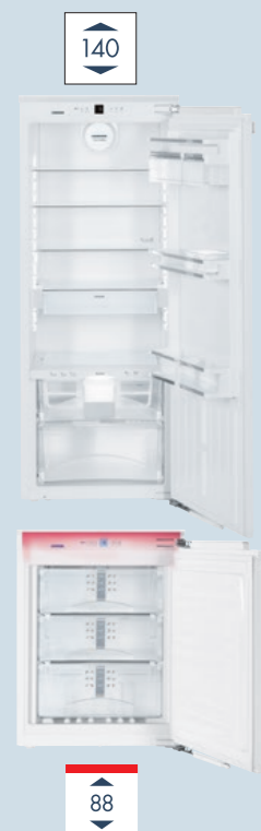
Можливі варіанти комбінації: Холодильна камера IKB 2720 + Морозильна камера IGN 1664