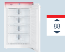
IGS 1624 IGN 1664

Це дозволяє морозильним камерам (висота ніші: 88 см) бути вертикально поєднаними з холодильником або шафою для вина будь-якої висоти.